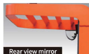
Rear view mirror