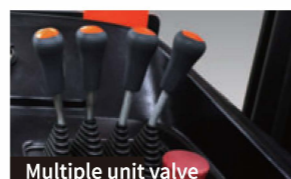
Multiple unit valve