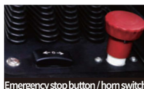
Emergency stop button / horn switch