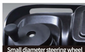
Small diameter steering wheel